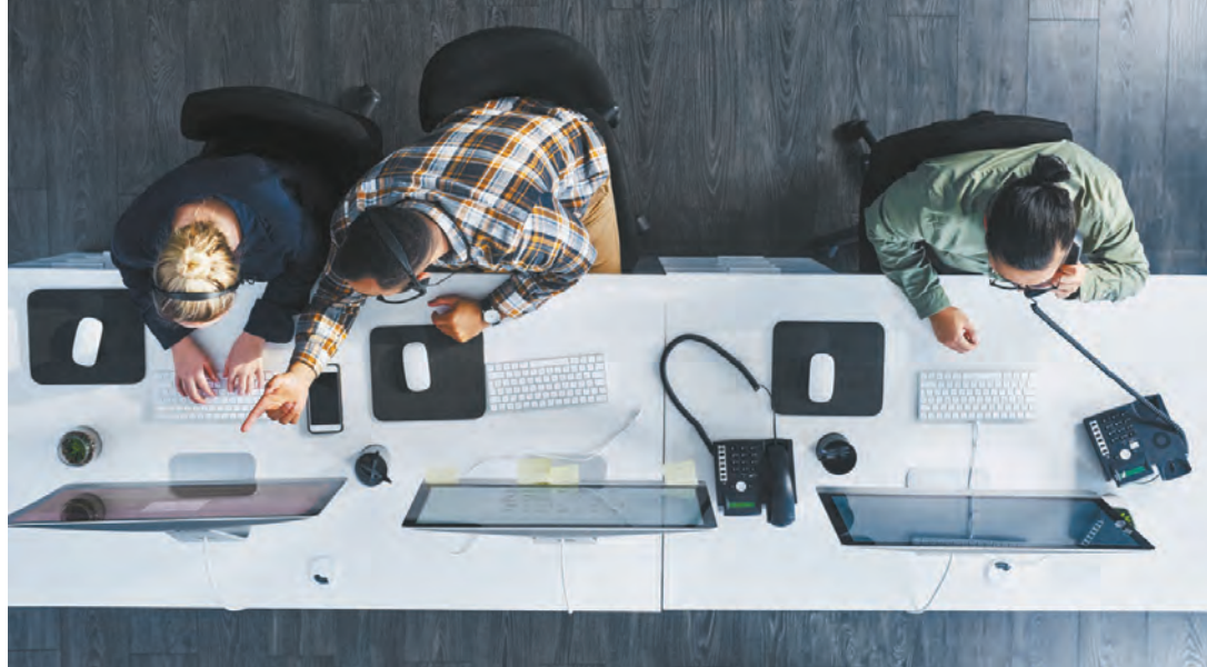
Plusieurs entreprises ont entamé le processus de francisation depuis l'entrée en vigueur de la loi 14.

Selon des données de l'Institut de la statistique du Québec, 73 % de la main-d'œuvre québécoise travaillait principalement en français