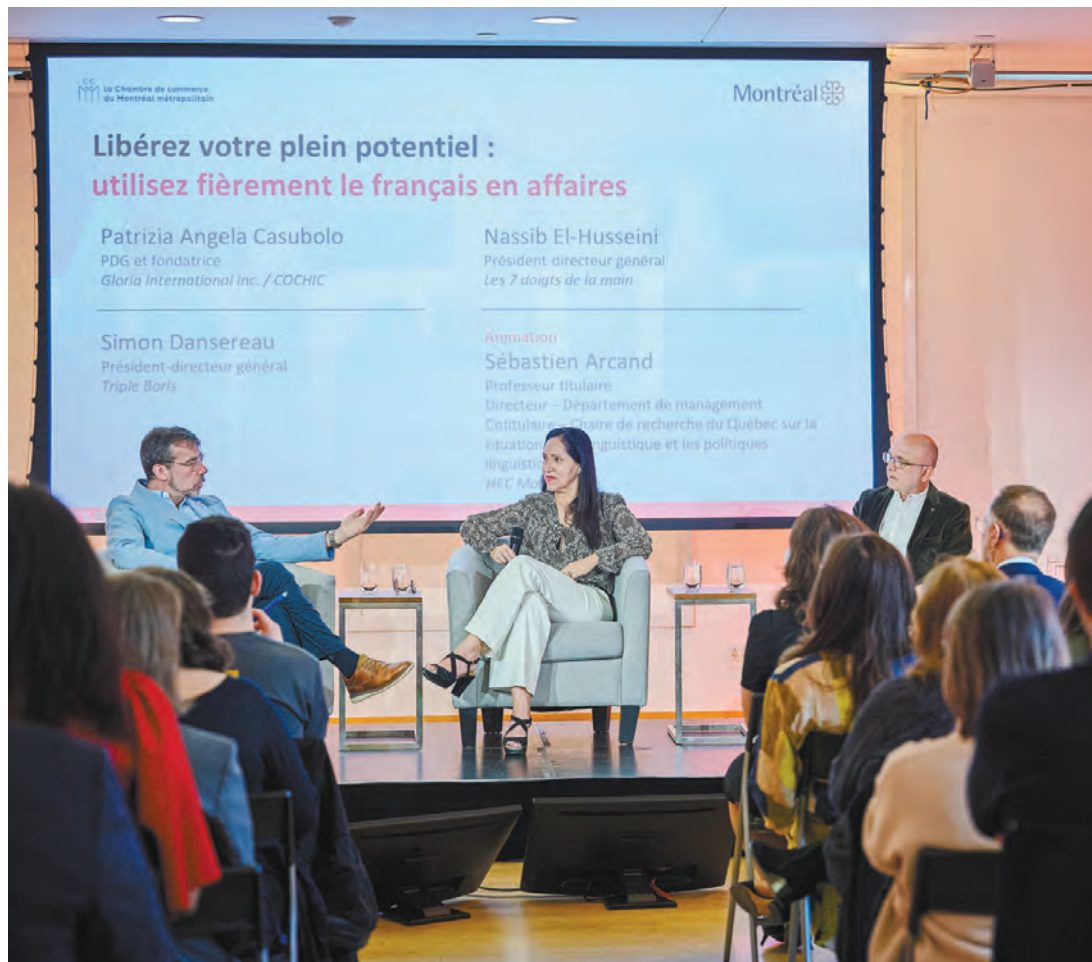
La Ville de Montréal et la CCMM lors d'un événement réunissant des acteurs importants du milieu des affaires pour démontrer les avantages de la francisation (avec l'appui du gouvernement du Québec).

En attendant, la CCMM continue de porter son message : le français n'est pas qu'une obligation à gérer, mais une occasion de développement d'affaires.